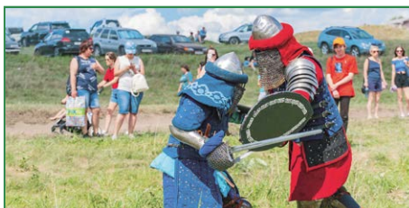
Масштабный фестиваль реконструкторов прошел под Новосибирском