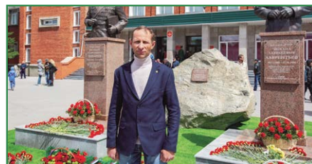
Кольцовцы приняли участие в праздновании юбилея НВВКУ