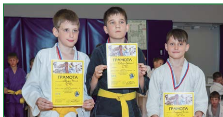
Бразильское джиу-джитсу в наукограде